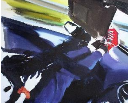
Andrea Fontanari - How We Would Drive -2023

Partendo da un intento iperrealistico e lavorando per sottrazione, Andrea Fontanari dipinge momenti che mettono a fuoco una nuova visione della vita quotidiana. I soggetti privilegiati della sua pittura sono elementi ordinari come piante, persone, oggetti e interni, rielaborati secondo uno stile in bilico tra figurazione e astrazione.